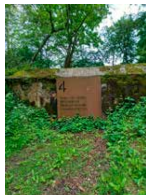
De foto is van bunker 4

weer opnieuw beschouwen, en verder gaan.