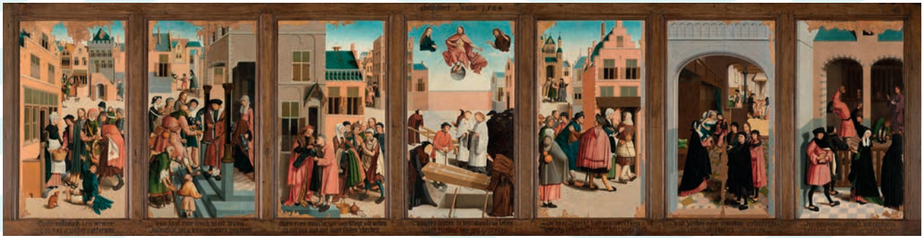
De zeven werken van barmhartigheid, Meester van Alkmaar 1504, Rijksmuseum Amsterdam